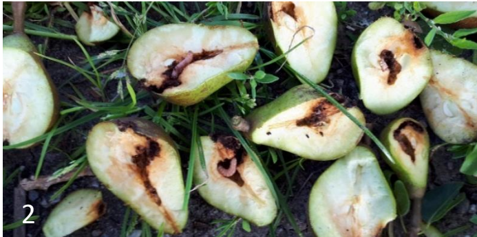
Foto 2. Inboringen van fruitmot in jonge vruchten van het ras Pierre Corneille op 19 juli 2021. Pierre Corneille is zeer gevoelig voor fruitmot. Het larvenstadium in de vruchten is het laatste larvenstadium.

Foto 1. Fruitmotschade bij de oogst van Conferenceperen op 7 september 2020. Eén larve ruïneerde drie peren.