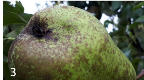
Foto 3 en 4. Het begin van de larvale aantasting in deze Conference peer is bij de kelk. Foto gemaakt vlak voor de oogst op 26 augustus 2020.

Foto 2. Inboringen van fruitmot in jonge vruchten van het ras Pierre Corneille op 19 juli 2021. Pierre Corneille is zeer gevoelig voor fruitmot. Het larvenstadium in de vruchten is het laatste larvenstadium.